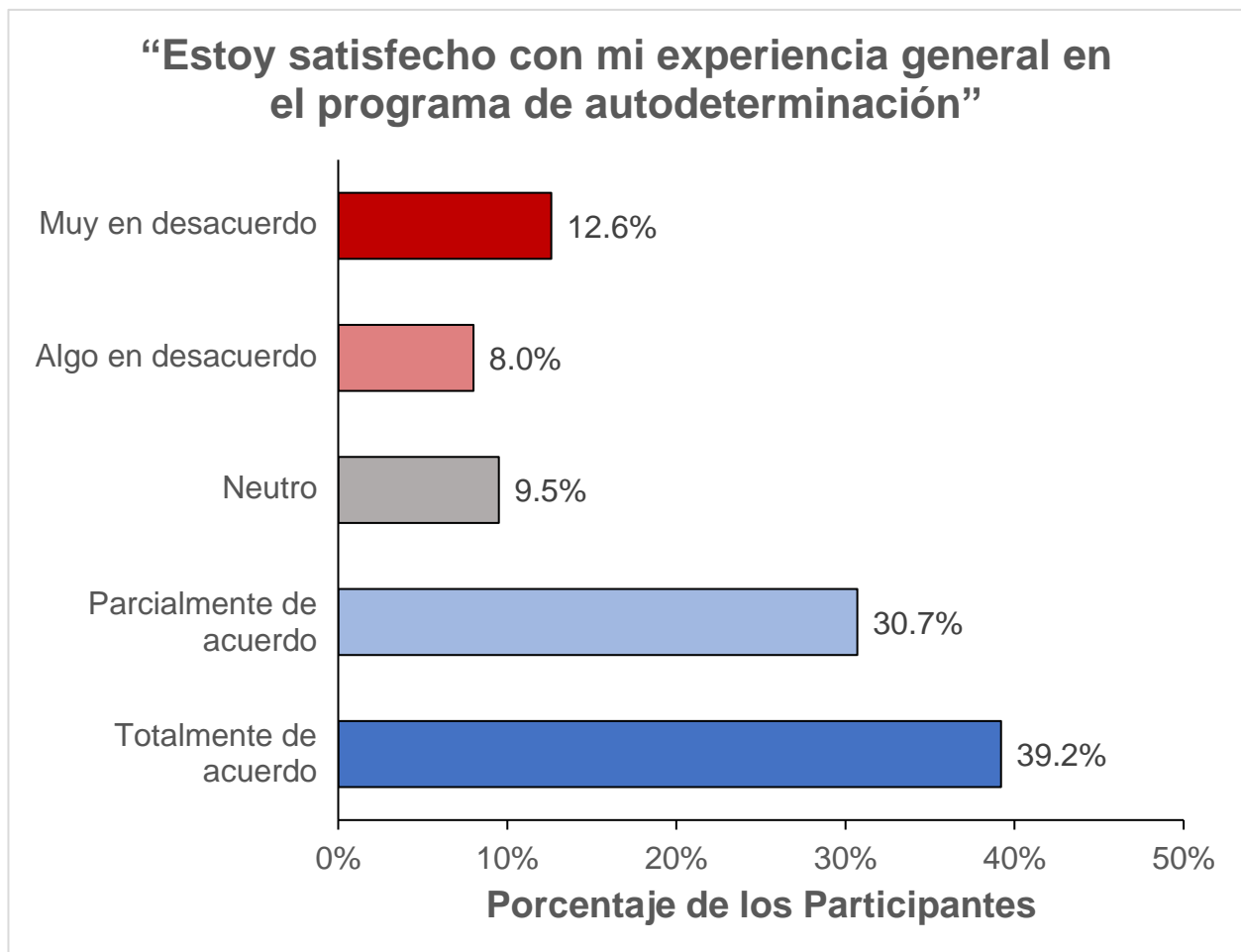
Resumen Ejecutivo Figura 1. Satisfacción en el Programa de Autodeterminación entre los Participantes y Cuidadores Actualmente Inscritos

3. Los Participantes Respaldan el SDP: Muchos participantes respaldaron el SDP, expresando su satisfacción y voluntad de recomendar el programa a otros. El 70 % de los encuestados estaba satisfecho con su experiencia en el programa, mientras que un porcentaje aún mayor (77 %) recomendaría el SDP a otras personas. Las respuestas abiertas destacaron que los participantes estaban contentos de estar en el Programa de Autodeterminación y creían que era la opción correcta para ellos. Varios participantes describieron el programa como "un cambio de vida", transmitiendo un sentido general de satisfacción con el programa y los beneficios que les ha brindado. Para resultados específicos relacionados con la satisfacción, componentes útiles y resultados positivos del SDP, favor de consultar las Figuras 1 y 2 de las fases 1 y 2, respectivamente.